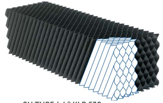
2H TUBEdek® KLP 638

Material: PP ► UV estabilizado, reforzado por talco (PPTV), color azul bajo pedido. PVC ► UV estabilizado.